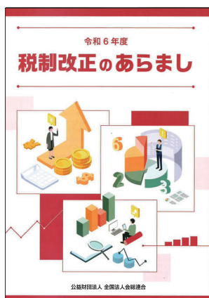
令和6年度 税制改正のあらまし